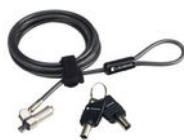
Cable de seguridad ultrafino con candado - dynabook (PA5364U-1KCL)